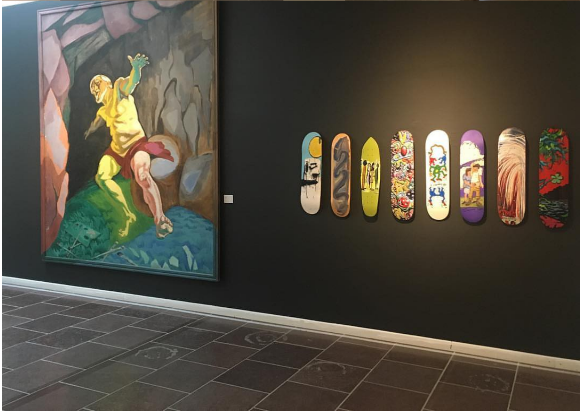
The Brask Collection mettes Willumsen