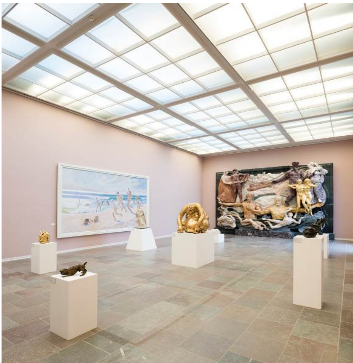
The Brask Collection meets Willumsen