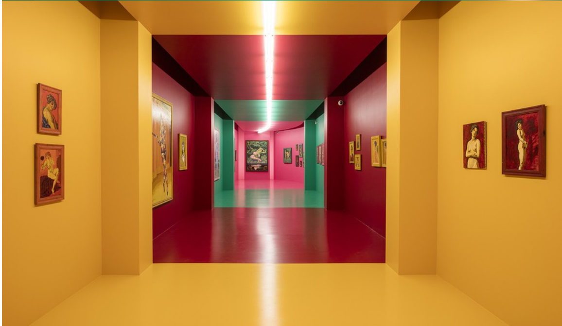
Udstilling med Willumsens værker på ARoS